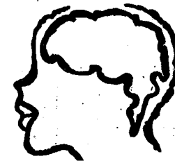
mògò kènè kun sèmè

dòlòmin bè kun sèmè fana tinyè, ka fa wuli i la san dama d'ò kònd.