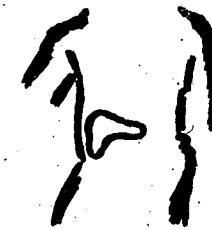
mògò kènè binyè

dòlòmin bè na ni bana jugu d'ò ye ka caya : o ye binyè d'imi sugu d'ò ye, n'a ka teli ka mògò faga.