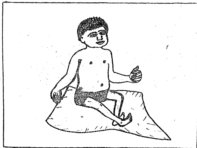
sensabana ye nìn den in sen sa

sensabana fana ye bana cèjugu ye. a banakisè bɛ̀ sɔ̀rɔ̀ min-nijiw fè.