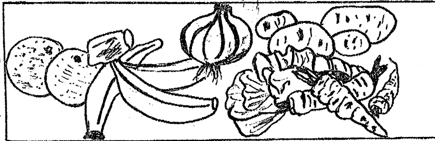
kana jiridenw ni nakòfènw dun n'i m'u ko