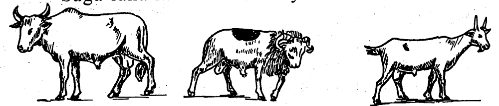
Misi ka fisa saga ye

Sinsinnin be ke fen minnu kan olu ye : siyaw, suguyaw, cenimusoya, si hake, keneya. Ni bagan misenw don, farikansiw cogoya ka kan ka laje. Baganlafa la, misi de ka fisa ni saga ye. Saga fana ka fisa n'a tow ye.