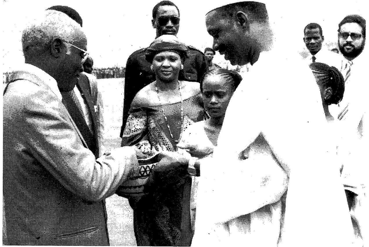
PERESIDAN A. PEREYIRA NI PERESIDAN MUSA TARAWELE

Mali lafiyalikow nógoyali ciyakèda dó lajèlen kófè, n'o ye SLENGE barasi ye, min bè sènèkèjiko ni