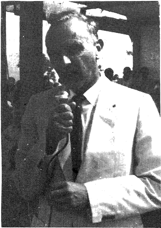
ALIMANYI FEDERALI JAMANA LASIGIDEN H. SEMANI

Baloko yèrèlabò sira kan, Alimanyi Federali jamana y'a Seke dama jira kè Mali dèmeni la. O hukumu kònò Mali teri jamana in ye mangasa caman jò k'a ban Mèti ni kucala ni Kita ni Tumutu ni Gawo maraw kònò, sumankisèw lamarali kèsèn jamanadenw ye gèlèya waativ nyèsigili la.