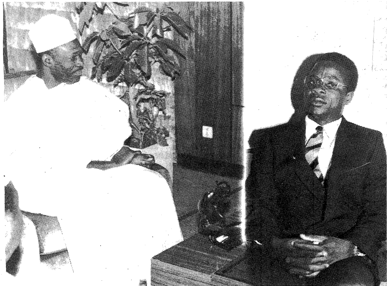
MALI FANGASO KUNTIGI ZENERALI MUSA TARAWELE NI SANTARAFIRIKI JEKULU NYEMOGO KA KUMANYOGONYA.