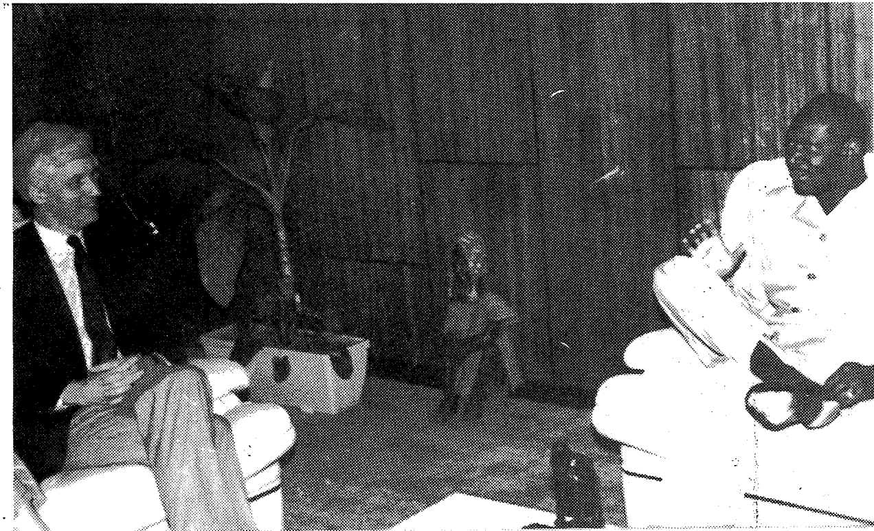
JAMANAKUNTIGI NI FARANSI ARAJOSO NYEMOGOBA