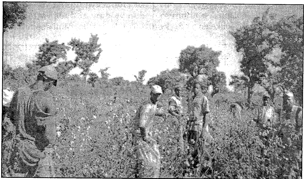
Mali musow ma to kɔ dugu jɛtaabaaraw si kɛnɛ kan.