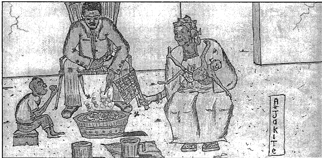
Bana man jugu bana ye, o kosən, bana bəe bə yeretangkun bə !

Səgəsəgəninje ye bana juguba ye Smin kasaara ka bon kosebe a banabagatə nə kerefeməgəw bəe ma. Bana juguba don min yelemə ka di, nə kunbən telinbali bə məgəw lasərə nəgənfə.