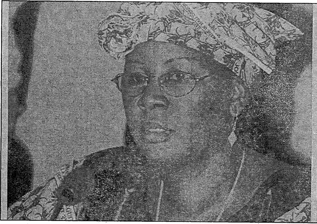
Madamu Mayiga Sina Danba Muso ni den ani denbaya sabatibolow minisiri.

Alamisadon, san 2009 ɔkutɔburukalo tile 15, Mali musow bɔra i ko kɔnɔkulu, Kolokani, diɛ togodalamusow tɔgɔladonba jɛnaje kɛnɛ kan. An kɔ dɔn ko nin yɔ siɛ 14 nan de ye diɛ togodalamusow ka jɛnaje kɛnɛ in be sigi sen kan san o san ɔkutɔburukalo tile 15.