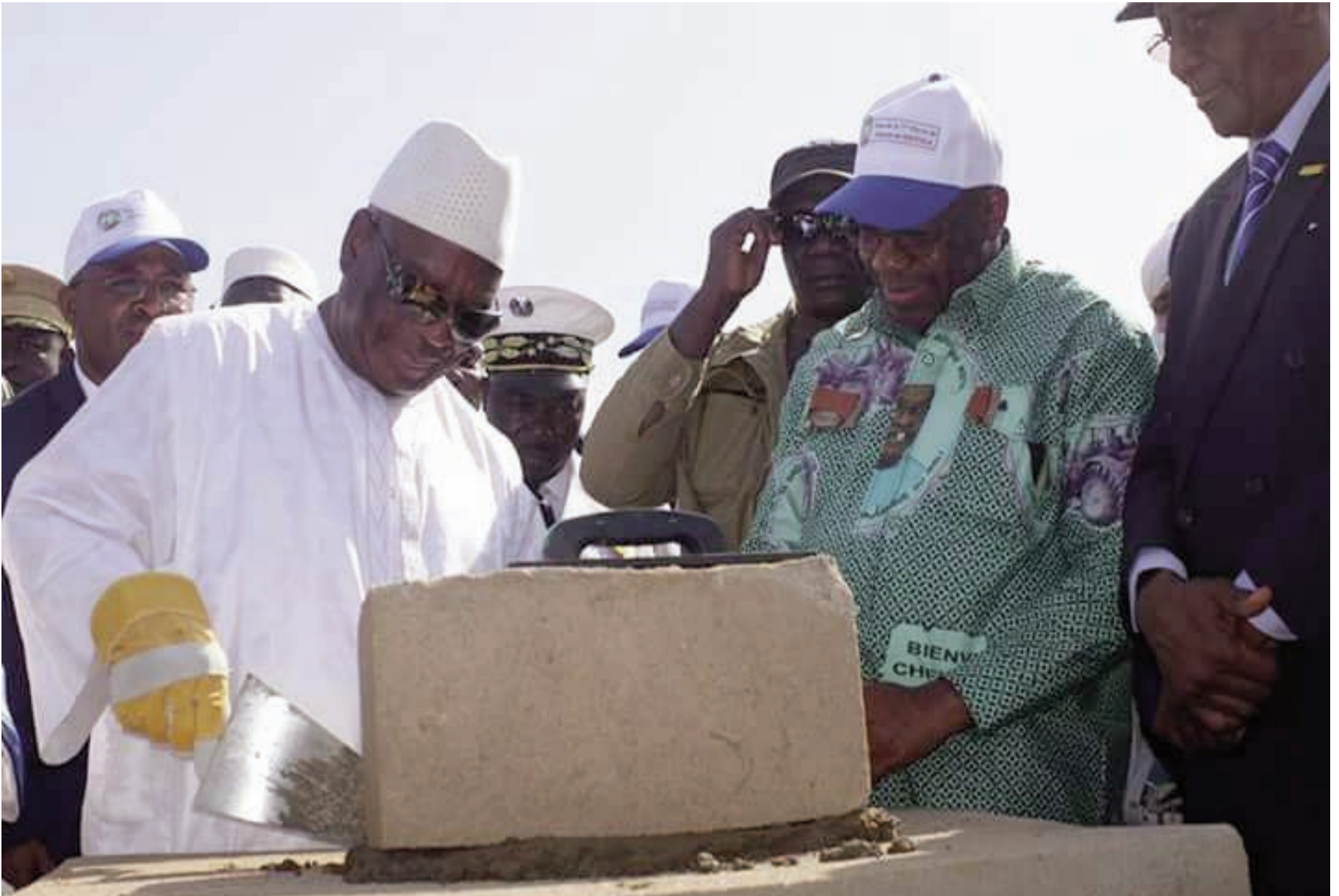
Jamanakuntigi be ka dogotōrosoba baara damine waleya ni kabakuru fəlɔ sigili ye.

nasugu bɛɛ bɛna kɛ min kɔnɔ, yanni san kelen cɛ.