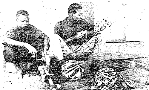
kunatów filè baara la, u kènèyalen kò. a bè tèmèn nin kan?

a san 20 de ye nyinan ye, ni kunatów ka seli bè kè dīnyè fan bèe. o waati kòndò, a jirala ko kuna ye bana ye, min tè yèlèma mògò fè, i n'a fò sògòsògòniyè, k'a bè se ka furakè k'a ban pewu, f'a tigiw ka fara mògò kènèmanw kan, k'u bè se yèrè ka sènè kè, ani bolo la baara caman, i n'a fò, numuya, geseda, jiribaara, dagadila, ani balò nvini sira caman wèrèw.