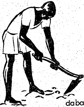
daba walima dabakuruni

sènè tè kè konyuman sènèkèminènw kò. olu nyumanw tè sòrò yòrò wèrè, ni èsikayèri tè.