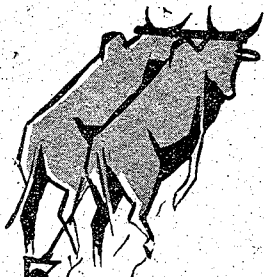
sari walima misidaba