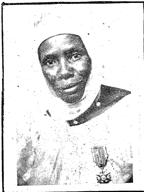
nin foto in tara baba tarawele de fè

salon san 1975, sètanburu kalo la, an balimamusò hatumata dukure, ni o bè wele yayi, ni mukutari jabi furumuso don, ni u sigilen bè kiban,