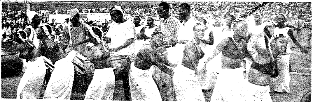
segu denmisen j̀èkulu de k̀èra f̀d̀l̀d̀ ye a k̀è b̀èè bannen k̀o

mali denmisènw ka sanfila nyònd̀dan nyènajè min k̀èra bamak̀d̀ k'a ta zuluye kalo tile 8 f̀d̀ kana a bila a tile 18 la, 1972 san na, kunnafoni minw b̀d̀ra o k̀d̀ǹd̀, olu de filè nin ye :