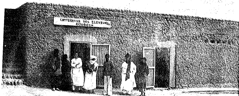
nin ye gawo baganmaralaw ka koperatiwu ye.