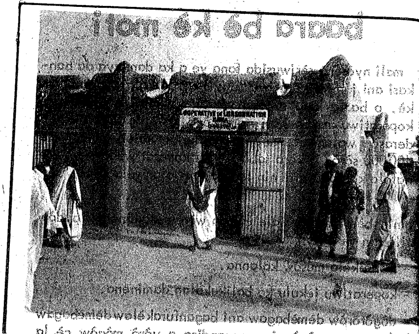
nin ye nara koperatiwu de ye.