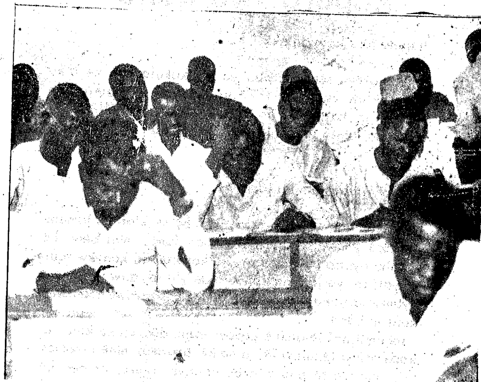
nin ja in tara koperatiwu baarakèlaw ka balikukalan fòlò sen fè bamakò

o tuma, koperatiwu ani federasònw nyèmògòya tènà to mògò bolo, min bōra fan wèrè. dugu kòndò mògòw de bè sugandi jama bēè lajèlen fè, ka nyèmògòya di u ma. nasarakarmèn garisan tènà kè sababu ye tugun ka mògò bila koperatiwu nyèmògòya la.