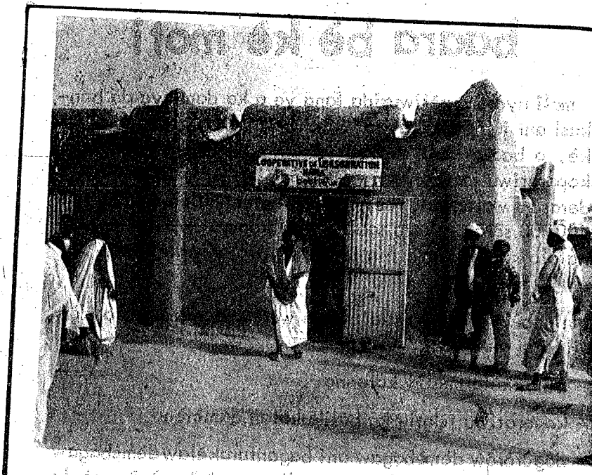
nin ye nara koperatiwu de ye.