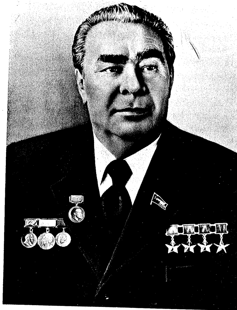
Leonid Breznev Chairman of the CPSU Central Committee General Secretary