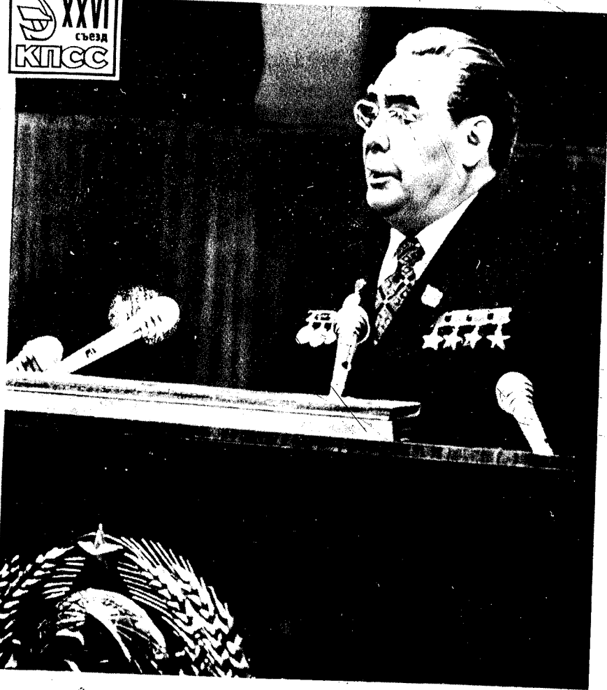
Leonidi Berezinev iniyon Sowiyetiki Pariti Kominisi Komite' Santarali Ka Sekerétéri Zénérali.