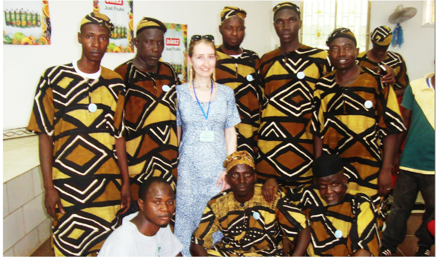
QUELQUES MEMBRES DE L'ACADEMIE N'KO ET UNE PARTICIPANTE RUSSE DE LA COMMÉMORATION

C'est pourquoi, les membres de l'Académie et tous les adeptes du N'ko en Guinée, en Afrique et à travers le monde font de la publication, leur priorité.