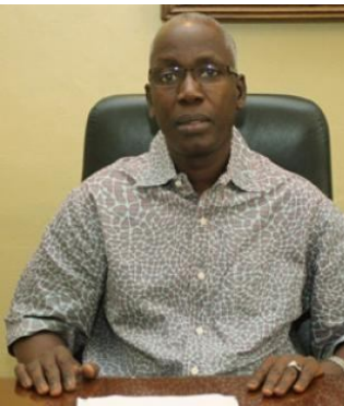
Ministre de l'Éducation, de l'Alphabétisation et de la Promotion des langues nationales.

Amadou Goncoul Doucoure est un juriste de haut niveau, diplômé de l'École nationale de la magistrature. Il a occupé plusieurs postes importants, notamment celui de procureur général, avant d'être nommé ministre de la Justice en 2011.