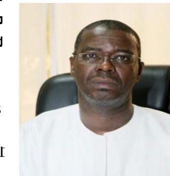
Ministre de l'Éducation, de l'Alphabétisation et de la Promotion des langues nationales.