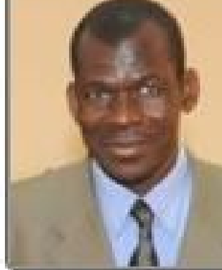
Ministre de la Jeunesse, du Travail et de la Formation professionnelle.