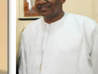
Ministre de la Fonction publique, de la Gouvernance et de la Réforme administrative.

Amadou Goncoul Doucoure est un juriste de haut niveau, diplômé de l'École nationale de la magistrature. Il a occupé plusieurs postes importants, notamment celui de procureur général, avant d'être nommé ministre de la Justice en 2011.