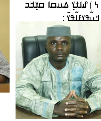
Ministre de l'Administration territoriale, de la Décentralisation et de l'Aménagement du territoire.