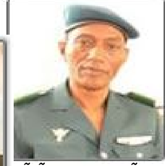
Moussa Sinko Coulibaly, ministre de la sécurité intérieure et de la protection civile.

Amadou Goncoul Doucoure est un juriste de haut niveau, diplômé de l'École nationale de la magistrature. Il a occupé plusieurs postes importants, notamment celui de procureur général, avant d'être nommé ministre de la Justice en 2011.