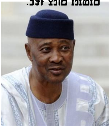
Amadou Goncoul Doucoure, ministre de la Justice, garde des sceaux.

Amadou Goncoul Doucoure est un juriste de haut niveau, diplômé de l'École nationale de la magistrature. Il a occupé plusieurs postes importants, notamment celui de procureur général, avant d'être nommé ministre de la Justice en 2011. Sa réélection est une reconnaissance de son rôle crucial dans la consolidation de la démocratie ivoirienne.