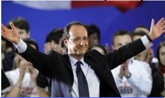
Le ministre de la Justice, garde des sceaux, Amadou Goncoul Doucoure , a été réélu député de l'Assemblée nationale lors des élections législatives du 29 mai 2012.

Amadou Goncoul Doucoure, ministre de la Justice, garde des sceaux, a été réélu député de l'Assemblée nationale lors des élections législatives du 29 mai 2012. Il a obtenu 104 voix sur 107 suffrages exprimés, ce qui représente une majorité absolue. Ce résultat confirme sa popularité et son engagement en faveur de la justice et de l'état de droit en Côte d'Ivoire.