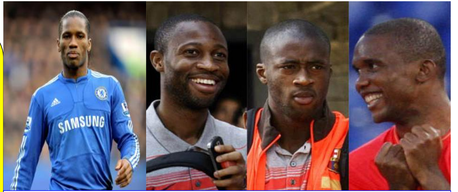
የሰነድ ገጽ 28-29 ሰኔ 2012 / ሰኔ 2012

የሰነድ ገጽ 28-29 ሰኔ 2012 / ሰኔ 2012 ገጽ 28-29 ሰኔ 2012 / ሰኔ 2012 ገጽ 28-29 ሰኔ 2012 / ሰኔ 2012