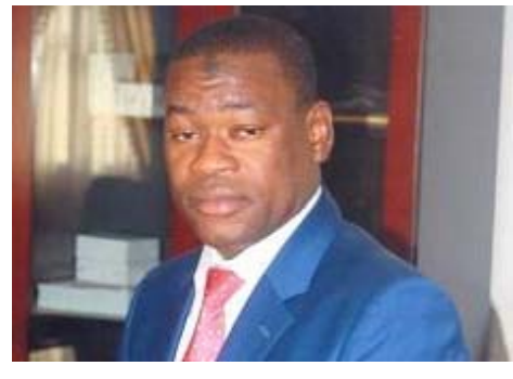
የግብርና ስርዓት ማረጋገጥ አገልግሎት ማስገኘት