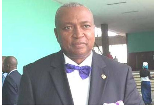
የግብርና ስርዓት ማረጋገጥ አገልግሎት ማስገኘት