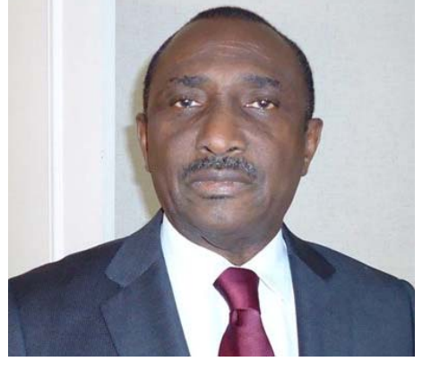
የግብርና ስርዓት ማረጋገጥ አገልግሎት ማስገኘት