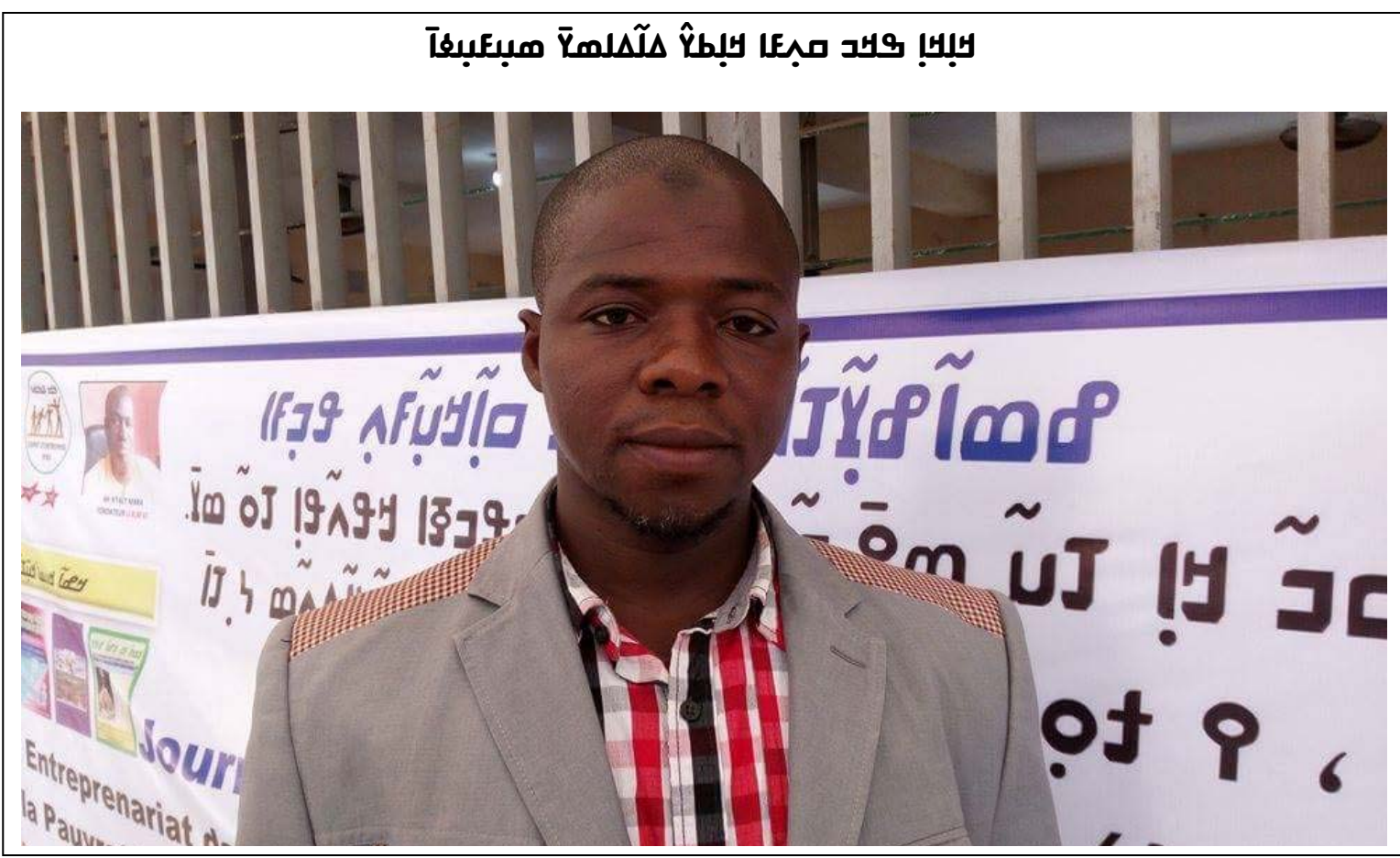
የሰነድ ስልጠና ለሰጠው ሰው

በዚህ ስልጠና ውስጥ ለሁሉም ሰዎች ሊኖሩ ይገባል። ለዚህም ዓይነት ስልጠናዎች ለሁሉም ሰዎች ሊኖሩ ይገባል። ለዚህም ስልጠናዎች ለሁሉም ሰዎች ሊኖሩ ይገባል።