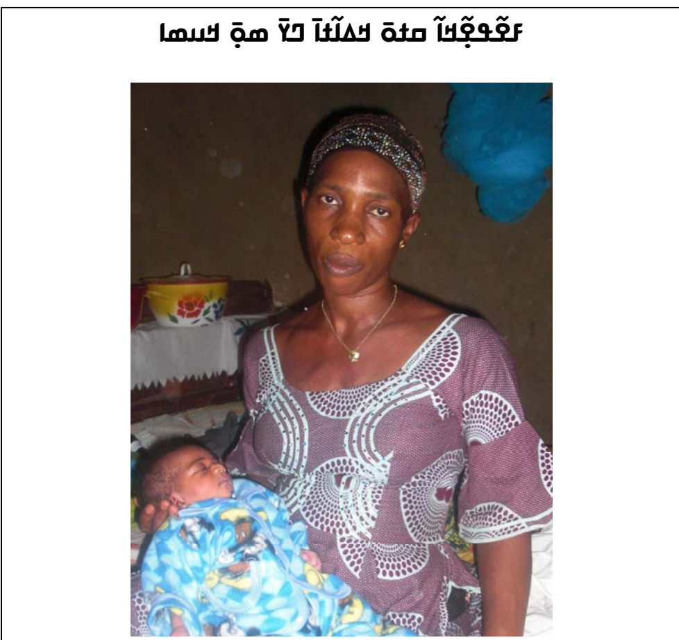
የሰነድ ስልጠና ለሰጠው ሰው