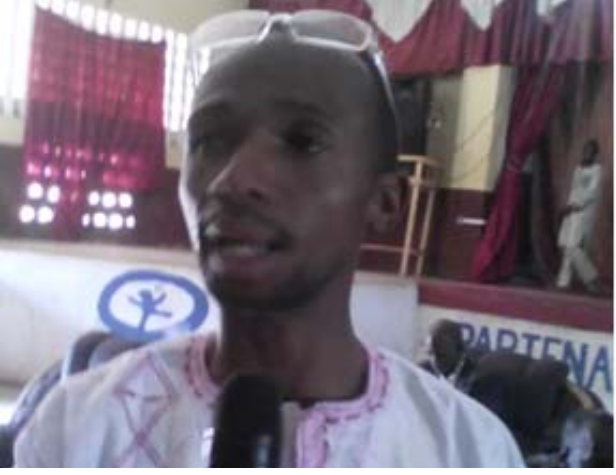
ገጽ የሚገኝ ድምጽ ሰነድ ላይ ለመጻፍ የሚያስችል