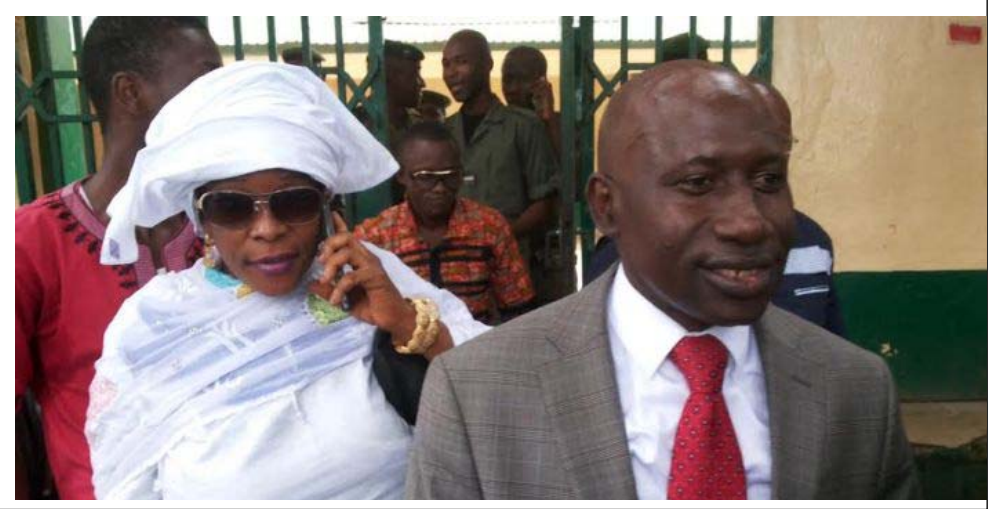
የድምፅ ማቀናበር ስልጣን ለማውጣት ማሳሰቢያ

የድምፅ ማቀናበር ስልጣን ለማውጣት ማሳሰቢያ የሚለው ስልጣን ለሕዝብ ምክርቤት ማውጣት ማሳሰቢያ ነው።